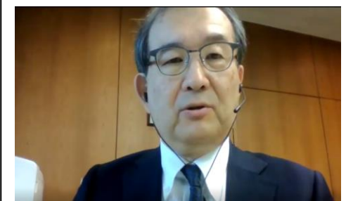
建築研究所 澤地理事長