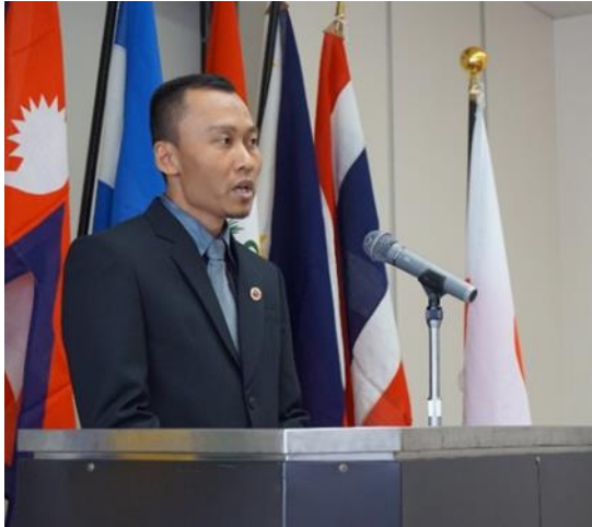
Cérémonie de clôture