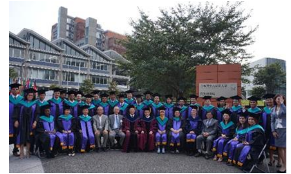
Cérémonie de remise des diplômes à GRIPS

Le programme de formation de l'IISEE est organisé en collaboration avec L'Agence Japonaise de Coopération Internationale (JICA). Les candidats doivent s'inscrire aux cours dans le cadre du programme de formation et de dialogue JICA mis au point dans le cadre de l'aide publique au développement du Japon. Le coût de la formation et de la vie est assurée par IISEE / BRI et la JICA.